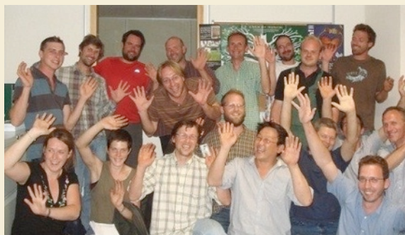
Agricovert, c'est eux !

Par leur approche, elle souhaite sensibiliser le citoyen à choisir ses légumes de manière écologique tout en lui montrant que derrière chaque légume, il existe un producteur, sans oublier tout le travail de ce dernier pour obtenir ce produit. Agricovert se pose comme « un bouillon expérimental de savoir-faire agricole, un lieu d'échanges entre producteurs, et consom'acteurs ainsi qu'un lieu de formation continue, de création d'emplois durables, de soutien aux nouveaux producteurs » afin de donner, à une population intéressée, accès à des produits de qualité à des prix justes pour chacun. Encore un projet qui se retrouve à mille lieux de ce contexte de concurrence malsaine véhiculé par le libre marché ! En effet, comme souligné dans notre